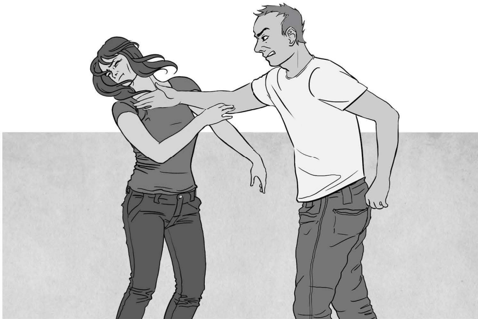
Violencia física (Ley 26485)- Modalidad violencia doméstica