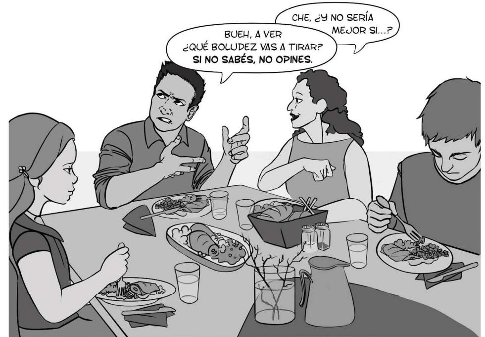
Violencia psicológica (Ley 26485)